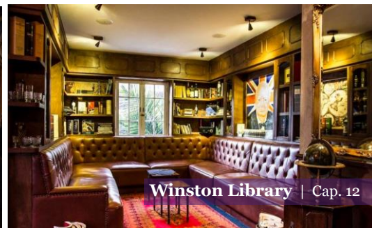
Winston Library | Cap. 12