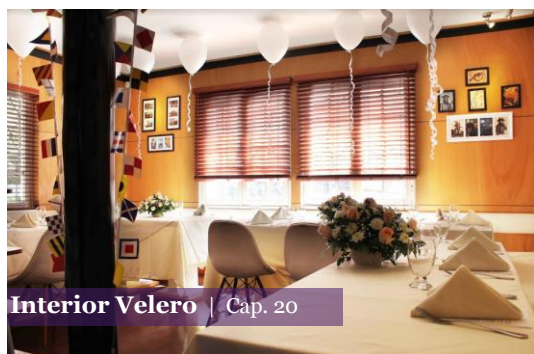
Interior Velero | Cap. 20