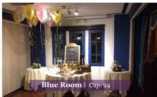
Blue Room | Cap. 24