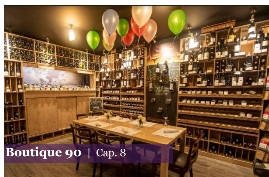
Boutique 90 | Cap. 8