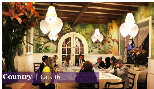
Country | Cap. 16

Restaurante Daniel está ubicado en una casa esquinera de dos pisos en la Calle 73 con Carrera 10 y cuenta con varios salones privados con ambientaciones diferentes.