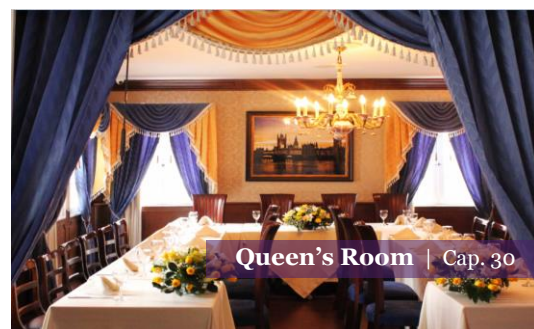
Queen's Room | Cap. 30

En el segundo piso podemos atender reservas de hasta 60 personas. Le reservamos todo el piso.