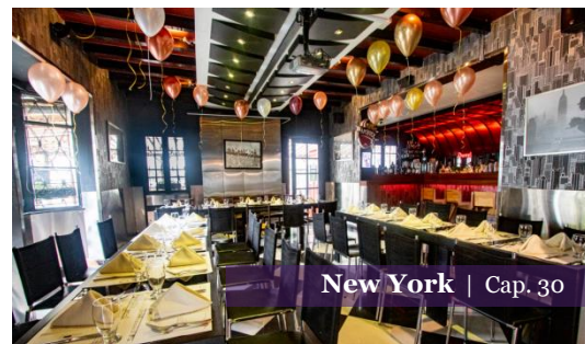
New York | Cap. 30