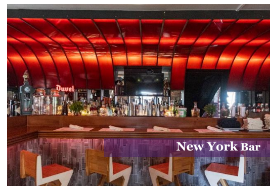
New York Bar