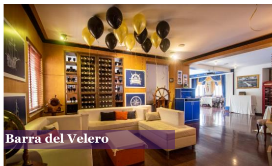
Barra del Velero