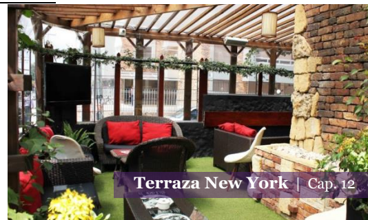
Terraza New York | Cap. 12