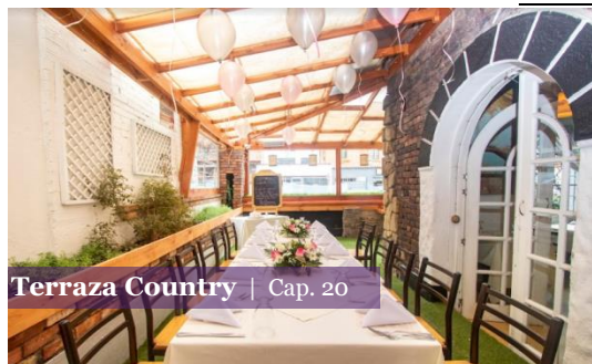
Terraza Country | Cap. 20